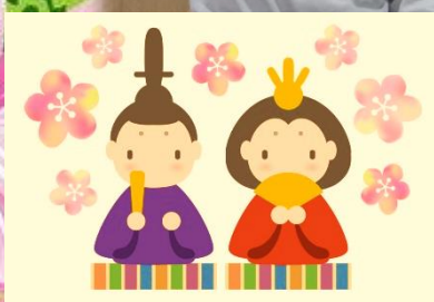
皆で冠を作りました。これで私たちも姫ですね。